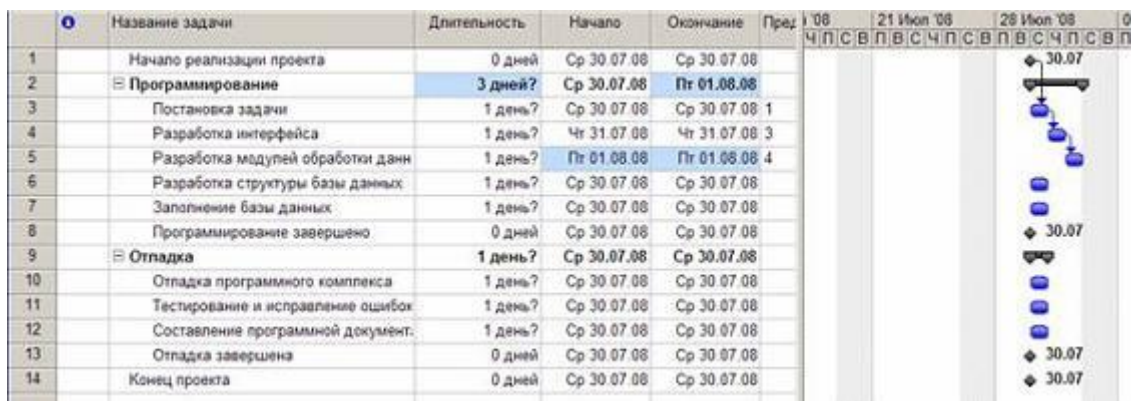
Рис.Создание связи через столбец Предшественники